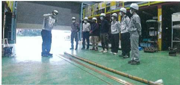
▲工場で工具の説明から実践へ

先輩社員による実践を見てからの作業になり、作業中も先輩社員が見て回りながら声をかけてくれます。▼