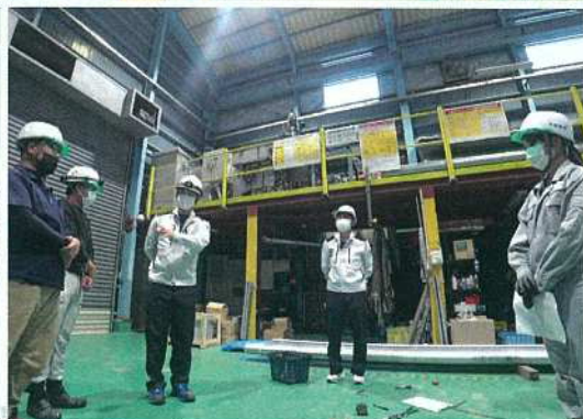
▲丸一日使用してしっかり学び、最後に講師から問題が出され、社員皆で考え、話し合いながら実践し、成果の確認後、終礼。