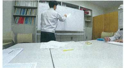
▲基本的な名称など勉強